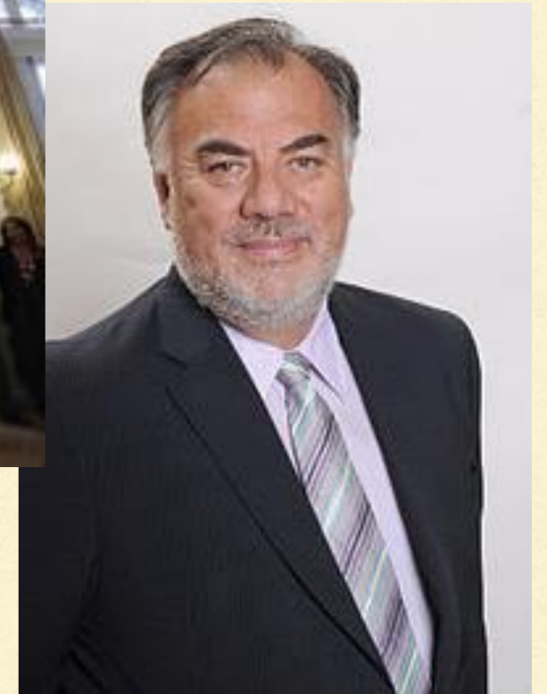
Osvaldo Andrade, Presidente de la Cámara de Diputados